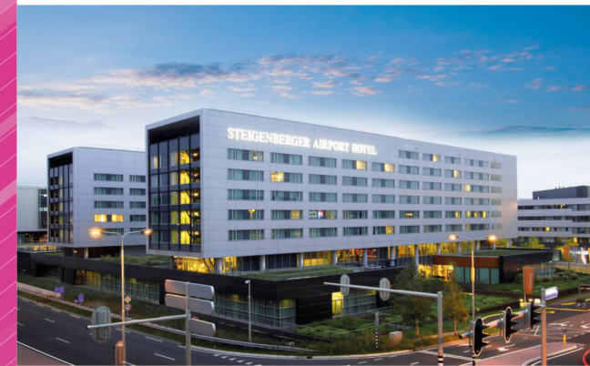
Steigenberger Airport Hotel Unterschweinstiege 16 60549 Frankfurt am Main

Wenn Sie mit der Bahn anreisen, profitieren Sie von bis zu 59 % Ersparnis gegenüber dem regulären Fahrpreis (abhängig von Strecke und Buchungsklasse), wenn Sie im DB Service Center unter der Nummer +49 (0)1806 31 11 53 mit dem Stichwort „Steigenberger Hotel“ Ihre Reise buchen (Montag bis Samstag von 07:00 - 22:00 Uhr).